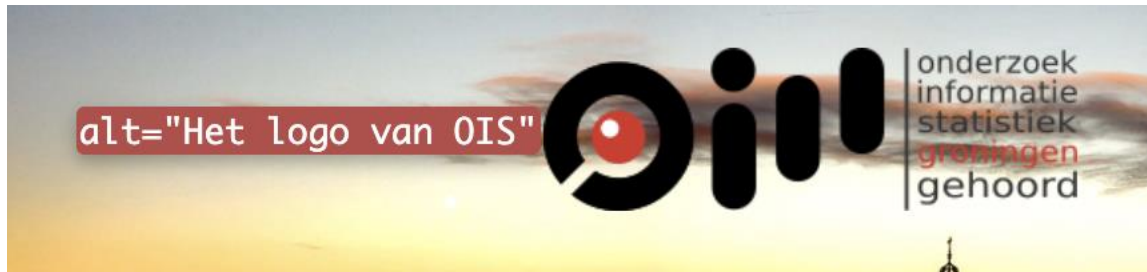
Figuur 1: Alternatieve tekst van het logo komt niet overeen met de zichtbare tekst