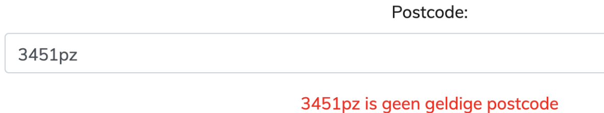
Figuur 8: foutmelding is onduidelijk